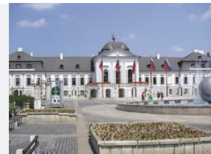
Sídlo prezidenta Slovenskej republiky