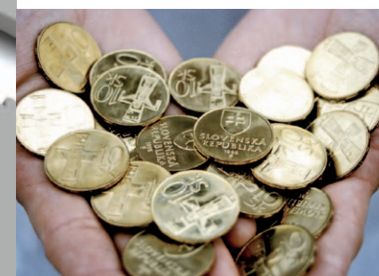
Prvé slovenské korunové mince

Proces konštituovania Slovákov ako moderného európskeho národa vyvrcholil 1. januára 1993 vznikom samostatného štátu – Slovenskej republiky. Definitívne sa tak naplnili snahy národnej emancipácie Slovákov, ktoré sa naplno rozvinuli aktivitami štúrovskej generácie a pokračovali memorandovým hnutím z roku 1861, politickými aktivitami reprezentantov Slovákov v mnohonárodnostnom Uhorsku a politickými a kultúrnymi počinmi Slovákov v novo-vytvorenej Československej republike po roku 1918.