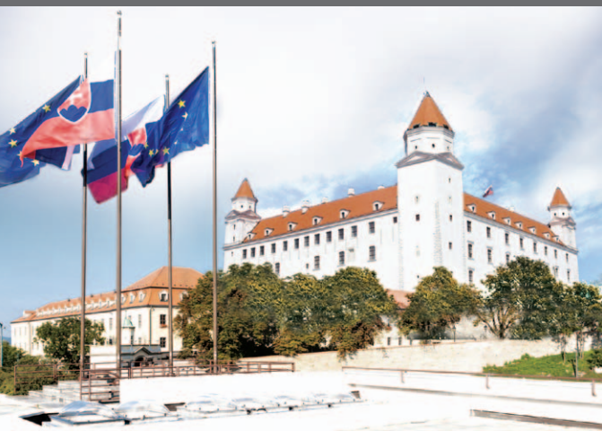
Bratislavský hrad so zástavami SR a EÚ