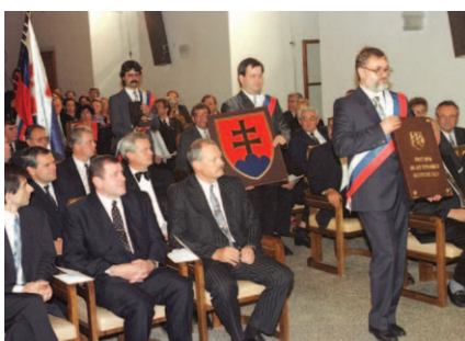
Slávnostná ceremónia z podpísania Ústavy SR 3. septembra 1992