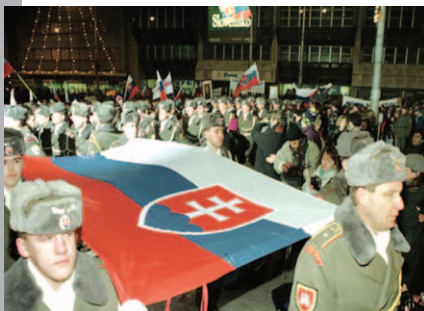
Oslava vzniku SR 1. januára 1993 na Námestí SNP v Bratislave