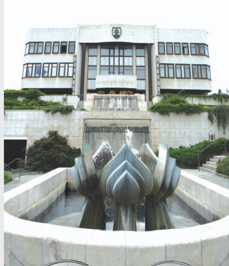
Foto: NBS archív, Progress Promotion, TASR, Wikimedia (Juraj Hovorka, Martin Proehl) http://www.nbs.sk/sk/bankovky-a-mince/eurove-mince/zberatelske

Vydala: © Národná banka Slovenska, január 2018