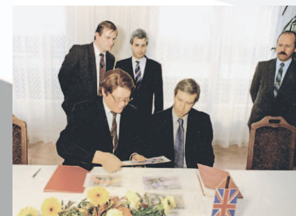
Podpis zmluvy o výrobe slovenských bankoviek vo februári 1993