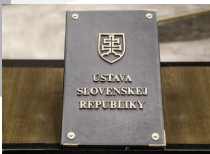
Ústava Slovenskej republiky prijatá 1. septembra 1992