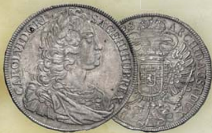
Nové platidlo za doby vlády Karla VI.