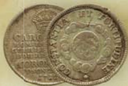
Zlatý obětní peníz císaře Karla VI.