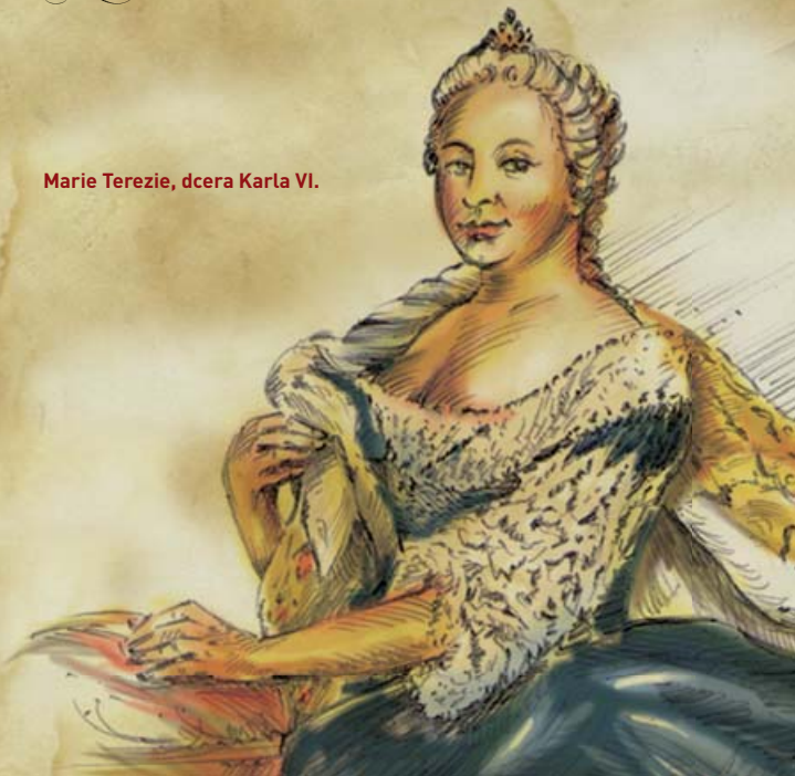
Marie Terezie, dcera Karla VI.

Manželství Karla s Alžbětou bylo dlouho bezdětné. Císař byl pochopitelně z této situace velmi nešťastný, a proto v té době vypracoval dokument upravující následnictví na habsburském trůnu, Pragmatickou sankci, v níž byla ustanovena nedělitelnost habsburských držav a v případě vymření mužské linie Habsburků nástupnictví linie ženské. Teprve v roce 1716 se manželům narodil syn Leopold, který však po šesti měsících zemřel. Pak už se císaři rodily samé dcery, Marie Terezie, Marie Anna a Marie Amálie.