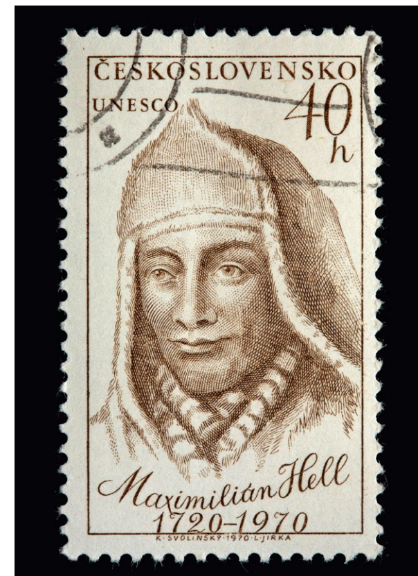
Výročná poštová známka Maximilián Hell 1720 – 1970, Československo

Svetové meno získal Hell zásluhou astronomickej ročenky Ephemerides Astronomicae. Redigoval ju od roku 1757 a nepretržite vychádzala až do roku 1807. Hellova ročenka začala vychádzať o desaťročie skôr ako britské odborné astronomické periodikum a o dve desaťročia skôr ako podobná edícia berlínskej akadémie. Ephemerides preto zverejňovali nielen výsledky pozorovaní viedenského observatória – stali sa aj publikačným fórom významných európ-