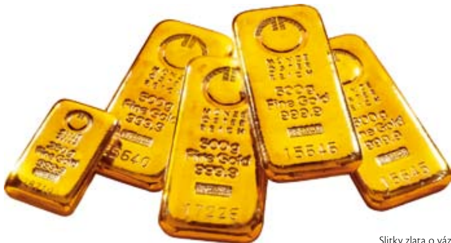
Slitky zlata o váze 500 gramů z produkce rakouské mincovny Münze Österreich

Kde zhodnotit peněžní prostředky, když se akciové trhy potácejí v nejistotě, americký dolar neustále klesá a vývoj inflace vyvolává obavy? Odpovědi na tuto otázku mohou být drahé kovy.