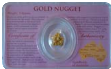
Australský zlatý nugget o váze 5 gramů v průhledné ochranné kapsli s certifikátem