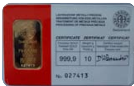
Slitek o váze 10 gramů s certifikátem formátu kreditní karty